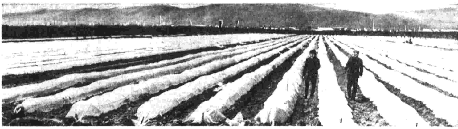
Турименский колхоз «Совет Турименщины» издается славится урожаем яблок, гранатов, слив и айвы, а с недавнего времени — столь же высокими урожаями ранних овощей.

В условиях суровой зимы на три месяца раньше срока завершено строительство 192-километровой стальной магистрали. Она подключена к трассе действующего газопровода Таск — Турус — Якутск. Голубое топливо Маастахского месторождения пришло в столицу республики и на предприятия Покровского промышленного комплекса. С вводом в эксплуатацию новой магистрали потребители якутского будут получать не менее миллиона кубометров газа.