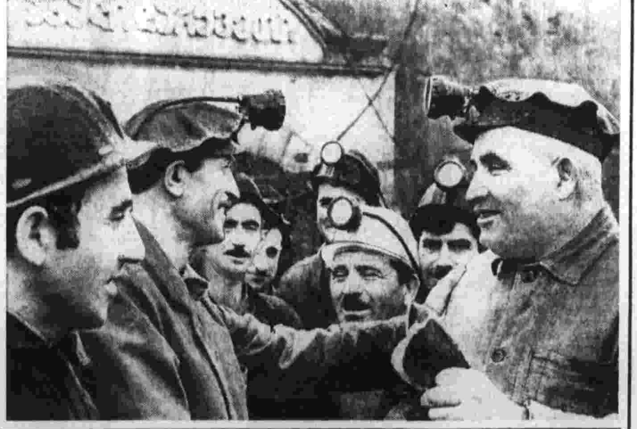
А. БОГМА. (Корр. «Правды»). Одесская область.

Над пригородными полями светит яркий солнце. Час от часу весна раздвигает границы сева. Еще вчера первыми прокладывали борозды овидиопольские и белгород-днестровские хозяйства, а сегодня включаются в работу посевные агрегаты в Раздельнянском, Коминтерновском и других районах области.