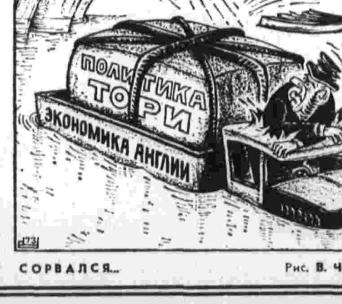
СОРВАЛСЯ... Рис. В. Чакридиса.

ВАШИНГТОН, 29. (ТАСС). Президент Р. Никсон направил вчера конгрессу послание, посвященное проблеме наркомании в Соединенных Штатах.