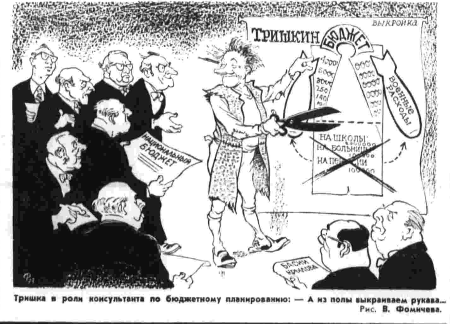
Тришка в роли консультанта по бюджетному планированию: — А из полы выкраиваем рукава... Рис. В. Фоминых.

Президент отметил, что рассчитывает на дальнейшее развитие экономических и культурных связей между Мексикой и СССР.