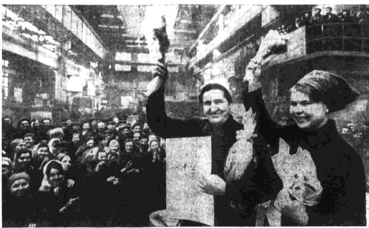
Большим уважением в трудовых коллективах пользуются передовики производства. В их честь устраивают вечера, лучшим присваивают почетные звания, награждают грамотами, ценными подарками.