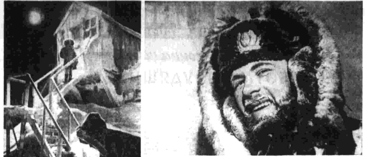
На мысе Челюскина работают зимовщики Арктического полярного радиометцентра. В трудных условиях они ведут исследования льдов, воды, снега, полярных сияний, ионосферы...