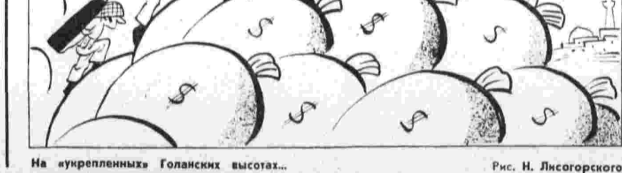
На укрепленных Голанских высотах. Рис. Н. Ляскогорова.

«Мне очень повезло с погодой, — заявил спортсмен. — Машина работала безупречно. Подъем был довольно опасным, особенно на призерных ледниках мотоцикла. Если бы свалился с узкой тропы в кратер,»