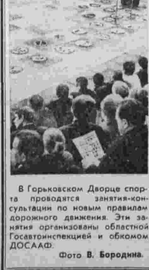
В Горьковском Дворце спорта проводится консультация по новым правилам дорожного движения. Эти занятия организуются областной Госавтоинспекцией и обкомом ДОСААФ.

РИГА. 15. [Корр. «Правды» В. Швейде]. Государственная Академия художеств Латвийской ССР отныне будет носить имя Героя Социалистического Труда, народного художника СССР скульптора Теодора Зальваря. Художник-реалист был одним из главных мастеров, участвовавших в реализации ленинского плана монументальной пропаганды.