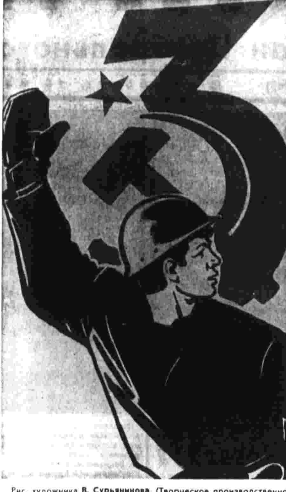
Рис. художника В. Сурьянинова. (Тюркеское производственное объединение «Гитплатек» Союза художников СССР).

брать в среднем по 45 центнеров хлеба, увеличить уборочную площадь под зерновыми на 600 гектаров. Предвесенняя взаимная проверка выполнения обязательств показала боевую готовность наших хозяйств к севу. Мы хорошо понимаем, что зерно — основа роста колхозной экономики, повышения благосостояния советского народа. Вот почему и забота о нем — главная. П. ВАСИЛЕНКО. Председатель колхоза имени Чкалова, Динской район Краснодарского края.