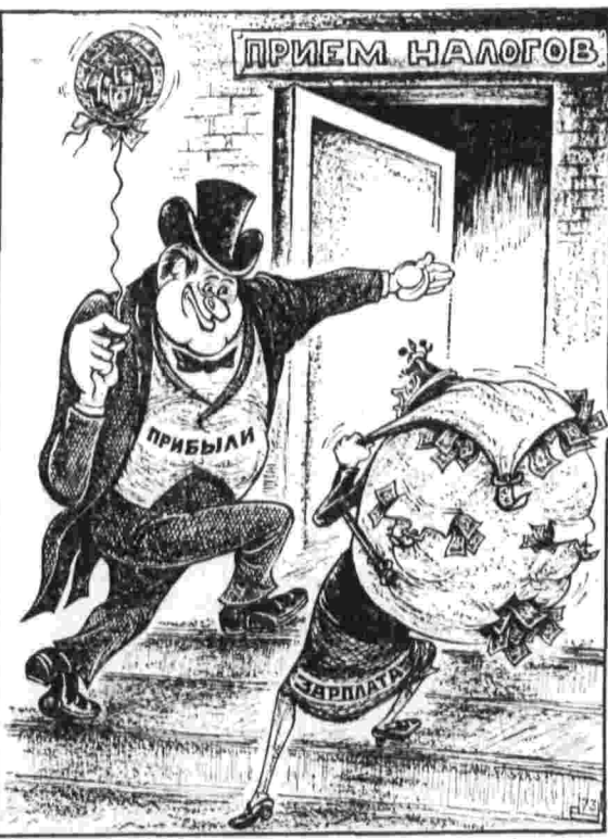
«Джентльменский» подход... Рисунок В. Чакридиса.

Б. ОРЕХОВ, (Соб. корр. «Правды»), г. Дамаск, мерт.