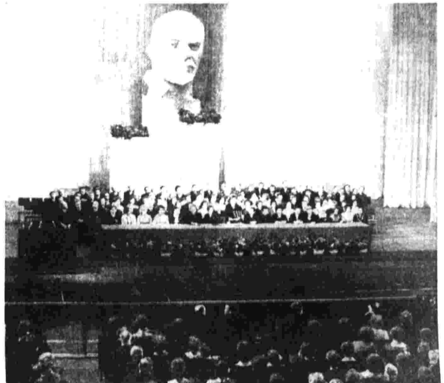
Москва. Большой театр Союза ССР. Торжественное собрание, посвященное Международному женскому дню.

Советские женщины вместе со своими братьями во труду, в освоении высокого трудового и политического подъема