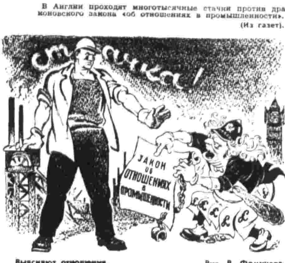
Выясняют отношения... Рис. В. Фомичев.

ВАШИНГТОН, 6. (ТАСС). «Головокружительной» цифрой назвали сенаторы Дж. Кейс и У. Проксмайр 11,3 миллиарда долларов, затраченных Соединенными Штатами в прошлом финансовом году на военную и экономическую помощь иностранным государствам. В своем докладе конгрессу они указали, что в 1972 году лишь на военные субсидии и займы иностран-