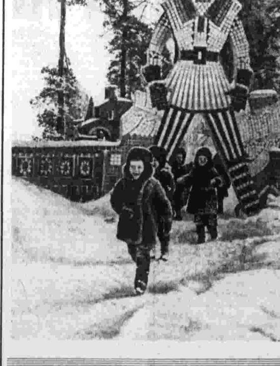
«Солнышко» — так называется детский оздоровительный санаторий Ленинградского городского отдела здравоохранения...