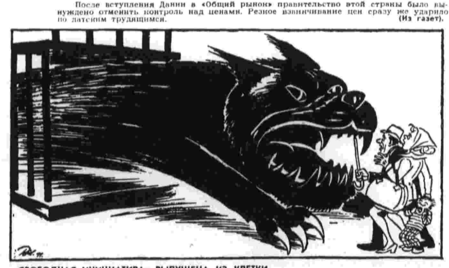
«СВОБОДНАЯ ИНИЦИАТИВА» ВЫПУЩЕНА ИЗ КЛЕТКИ. Рис. Х. Бидструпа из датской газеты «Ланд ог фольке».