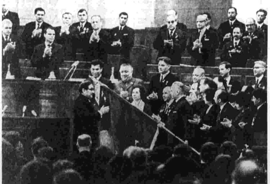
Москва, Большой Кремлевский дворец. Вручение ордена Ленина Всесоюзному обществу изобретателей и рационализаторов.

Съезд открыл председатель Центрального совета Всесоюзного общества изобретателей и рационализаторов Г. П. Софонов. Под бурные аплодисменты избирается почетный президент в составе Политбюро Центрального Комитета КПСС.