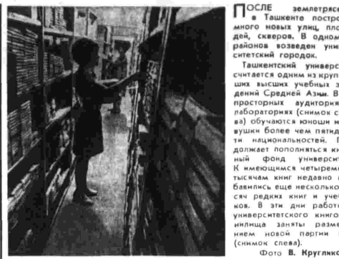
После землетрясения в Ташкенте построено много новых улиц, площадей, скверов. В одном из районов возведен университетский городок.