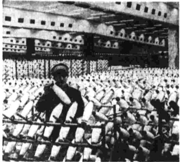
ВЕНГРИЯ. Успешно развивается химическая промышленность республики. Увеличивают выпуск продукции Боршадский комбинат, комбинат в Солонке, вискозный завод в Ньергезефалу и другие предприятия «Большой химии» страны. На с. и. м. в. в цехе готовой продукции вискозного завода в Ньергезефалу.