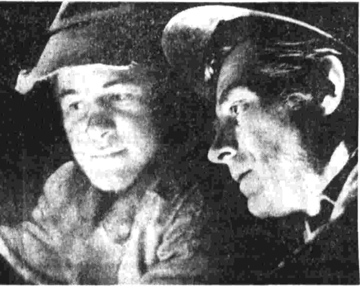
Все пусковые в строй!

ТОМСК, 27. (Внешт. корр. «Правды» Л. Левицкий). Николай еще Томский манометровый завод не выпускал за месяц столько продукции, сколько дал в январе. Однако суточный выпуск приборов и в феврале нарастает. Одновременно улучшается качество изделий. Одинадцать манометров недавно присвоено государственной Знак качества. Среди них — приборы для холодильной техники и судов. На заводе внедрена система управления качеством. Важнейший элемент ее — ритмичность производства.