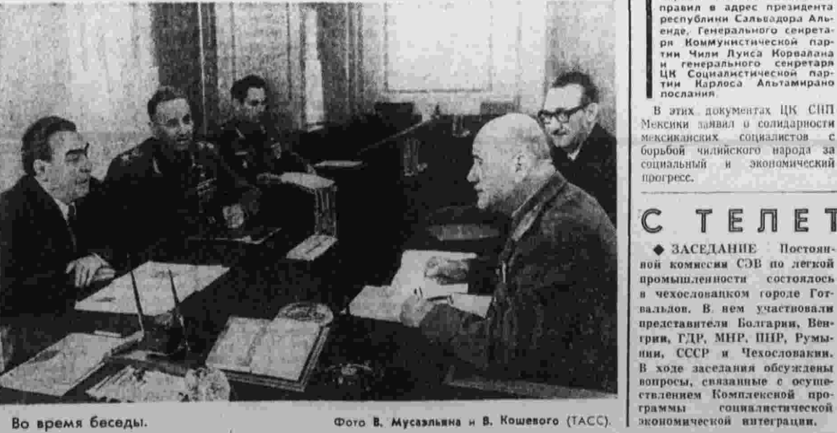
Во время беседы.

В беседе приняли участие министр обороны СССР Маршал Советского Союза А. А. Гречко и вояск АРЕ и СССР И. Кадер.