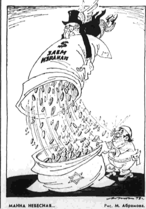
МАННА НЕБЕСНАЯ... Рис. М. Абрамов.

О. КИЛЕНКО. (Соб. корр. «Правды».) Хайдарабат — Мадрас.