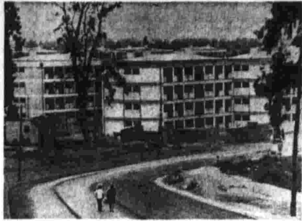
Правительство Чили продолжает выполнять программу Народного единства, которая предусматривает создание базы социального строительства. Наряду с другими важными проблемами решаются также жилищный вопрос. Существенную помощь жилищам в этом оказывает домостроительный комбинат, поданный Советским Союзом. И с ним же: новые жилые дома в рабочем пригороде Сантьяго.