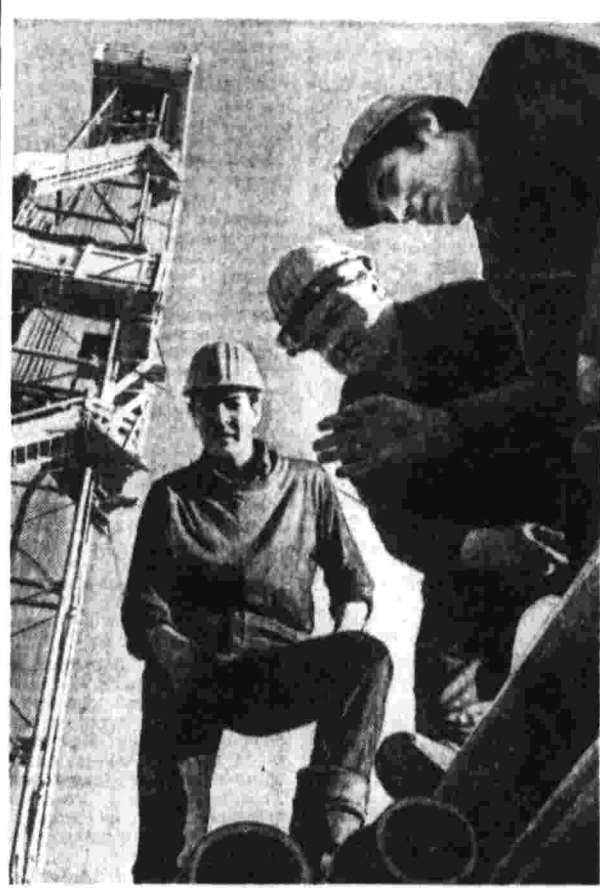
В ЗАПАДНЫХ районах Туринского бассейна в последние годы открыты запасы нефти. Неудачно преобретены некогда безлинейный край. Среди барханов поднялись сотни буровых установок, продолжены железнодорожные автомобильные дороги, выросли новые поселки, город нефтяников Небит-Даг.

ДАКА, 21. (ТАСС). Возглавляемая Музаффаром Ахмадом Бангладешская народная партия Бангладеш обнародовала свою программу на предстоящих 7 марта выборах в истори страны.