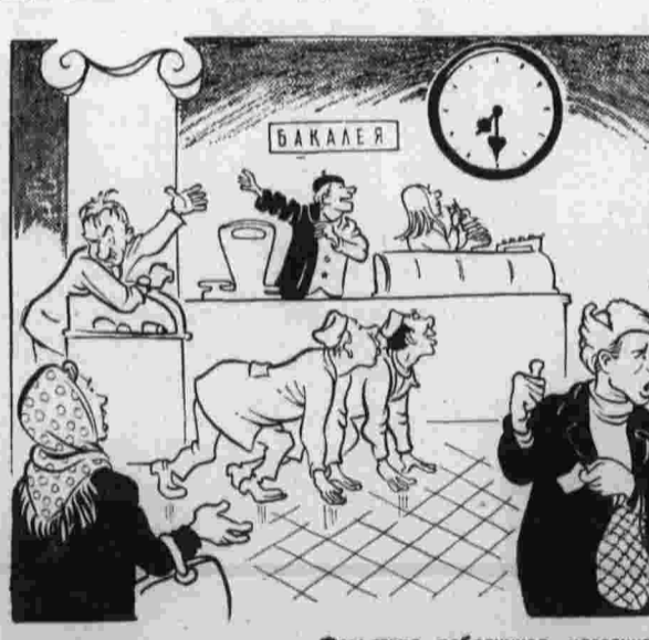
Фальшарт работников магазина. Рис. И. Васильева.

О неудовлетворительной работе ряда предприятий торговли и общественного питания Свердловская пишет читатель «Правды» И. Фамиров. Так, кафе «Москва» в обеденное время закрывается... на обед. По сообщению корреспондента «Правды» в Уфе некоторые магазины первого гортроторга и Ленинского райинспектора прекращают или резко сокращают торговые операции за полчаса-час до конца рабочего дня.