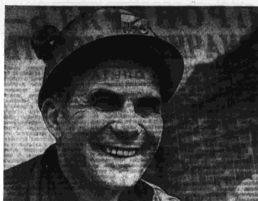
Фотоконкурс «Правды» Г. ШЕНЕФЕЛЬД (ГДР). Бригадир.

Обмен мнениями проходил в теплой, дружеской обстановке.