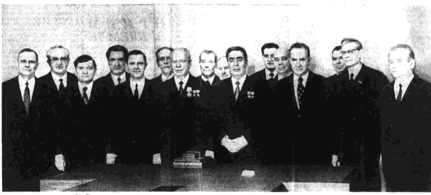
Руководители партии и правительства при вручении награды товарищу Н. В. Подгорному.

Идет третий, решающий год пятилетки. Партия призвала советский народ ознаменовать этот год ударным трудом на всех участках хозяйственного и культурного строительства. Земледельцы страны приняли повышенные социалистические обязательства. Теперь дело прежде всего за тем, чтобы все стороны подготовиться к выезду в поле и успешно провести весенний сея. Это позволит вырастить высокий урожай, восполнить недобор продукции в прошлом году.