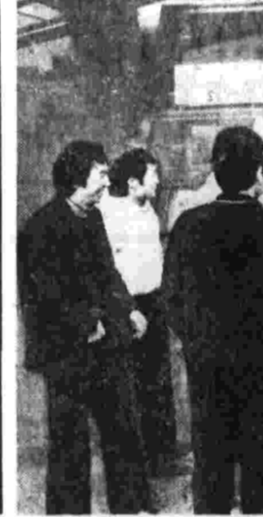
Прием посла Италии

Заместитель главного редактора газеты «Руде право», председатель Чехословацкого союза журналистов г. Прага.