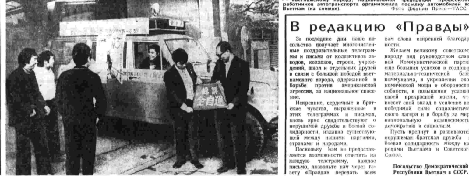
Японские трудящиеся развлекли «бор средств в помощь вьетнамскому народу. Национальная ассоциация работников автотранспорта организовала посылку автомобилей во Вьетнам (на снимке).

Империалисты стремились насладиться реакционными военными диктатурами. При этом различны формы, при всей разнице путей, открывающих процессы, протекающие в Чили и на Кубе, при всем их национальном своеобразии историческое содержание обоих событий сходно.