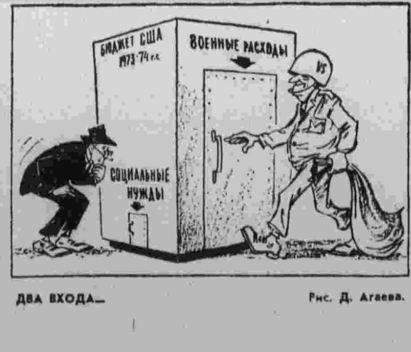
ДВА ВХОДА... Рнс. Д. Агаева.

В ответ администрация колледжа обратилась за помощью к полиции. Воровались в учебный корпус «блестящие порядки» арестовали 38 студентов и одного преподавателя, заявившего о своей солидарности с учащимися.