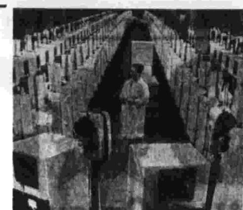
Более 6 тысяч холодильников «Саратов 2М» вышло с конвейера в 1972 году Саратовского завода электротехнического машиностроения.

В соответствии с программой исследования космического пространства 15 февраля 1973 года в 14 часов 12 минут московского времени в Советском Союзе осуществлен запуск автоматической станции «Прогноз-3».