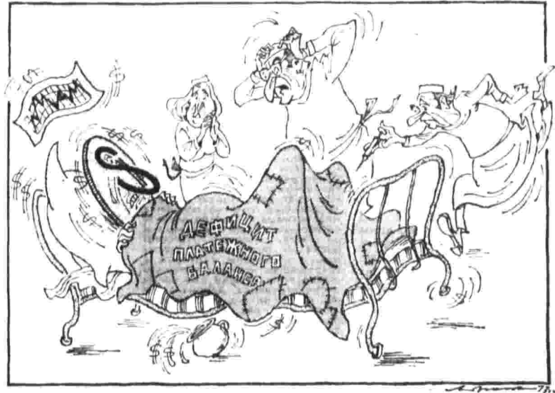
ДОЛЛАР В ЛИХОРАДКЕ.

В центре бесед — валютный кризис капиталистических стран и проблема таможенных тарифов. Девальвация американского доллара привела к новому витку переговоров еще более острого характера.