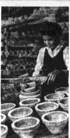
ДРВ. В результате бомбардировок семьи остались без крова и имущества. Сейчас все промышленные предприятия республики участвуют в восстановительных работах в квартале Динконг и прилегающей местности. И в центре в цехе фарфоровой фабрики провинции Хабан.

Вместе с рабочими предприятий столицы трудятся служащие государственных учреждений и партийных органов ДРВ. На развалины улицы Хвантхыен в районе Донга вышли сотрудики аппаратов Центрального совета профсоюзов, секретари.