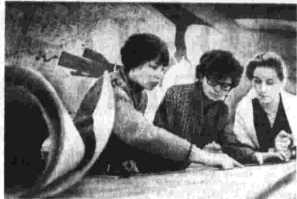
ПАНОРАМА МОЛОДЫХ ГОРОДОВ

Газета основана 5 мая 1912 года В. И. ЛЕНИНЫМ № 43 (19917) • Понедельник, 12 февраля 1973 г. • Цена 2 коп.