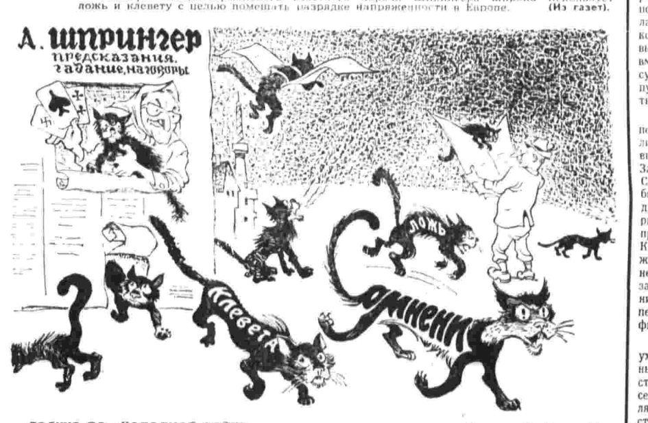
Тоскуя по «ХОЛОДНОЙ ВОЙНЕ»...

В связи с назревающей угрозой военного переворота трудящиеся страны намерены принять участие в забастовке. Кризисные профсоюзные объединения страны — Национальный комитет трудящихся Уругвая (НКТ) официально объявил, что рабочие и служащие забьют промышленные предприятия и выйдут на улицы, если антиправительственные акции не будут прекращены.