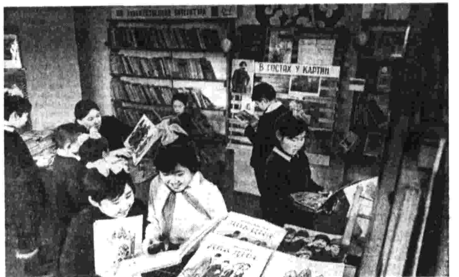
В ГОСТИ У КАПТИВ. В ГОСТИ У КАПТИВ. В ГОСТИ У КАПТИВ.