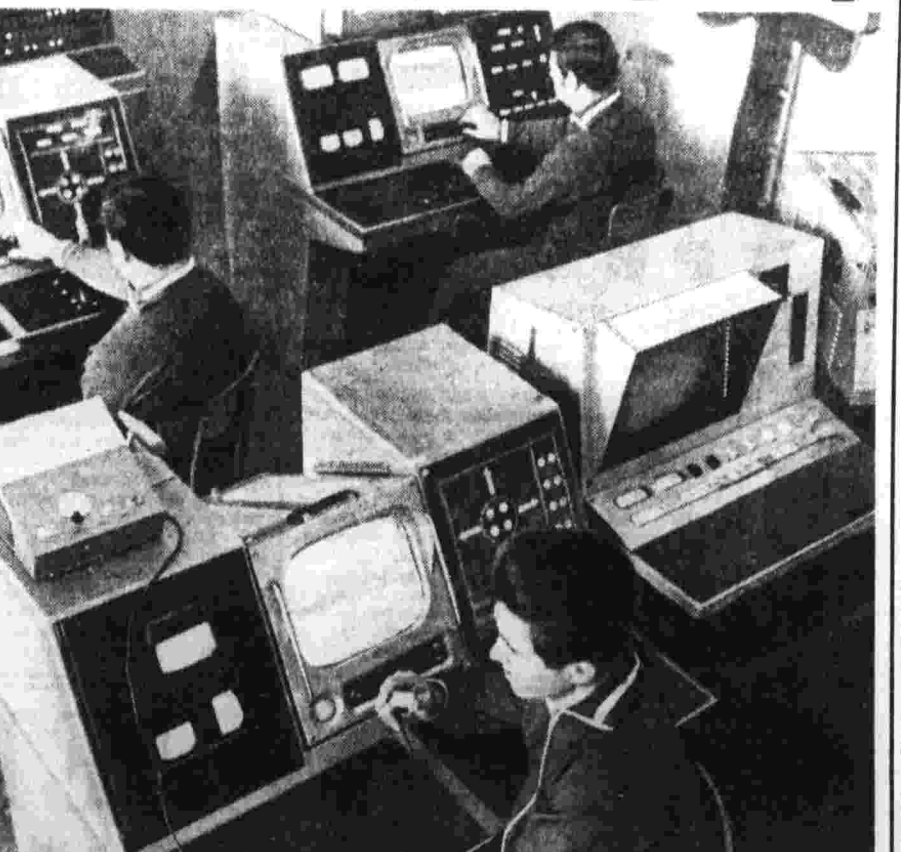
Центр дальней космической связи. На снимке: экипаж «Лунохода-2» за работой.

Программа измерений на сеансе научных измерений полностью выполнена. Все системы и научная аппаратура самоходного аппарата функционируют нормально. Следующий сеанс связи с «Луноходом-2» намечен на 10 февраля.