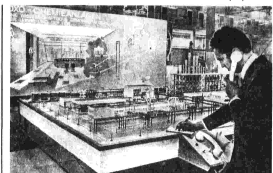
Химики ГДР в сотрудничестве с советскими специалистами создали новую установку, которая будет производить сырье для комментентелей. На снимке — модель установки АДН — Фотокоринка ТАСС.

для освобождения своих оккупированных территорий. Стороны рассмотрели необходимые шаги для усиления борьбы за справедливое урегулирование конфликта на Ближнем Востоке. Советская сторона подтвердила, что она будет продолжать свою политическую и экономическую поддержку Египта, будет способствовать укреплению его военного потенциала в соответствии с положениями советско-египетского Договора о дружбе и сотрудничестве от 27 мая 1971 года. Стороны отметили, что дружба и всестороннее сотрудничество между Советским Союзом и Египтом являются важнейшим фактором в борьбе против империалистической агрессии на Ближнем Востоке, за мир и безопасность народов этого района. Они подтвердили свое взаимное стремление развивать и укреплять советско-египетские отношения, строго руководствуясь положениями советско-египетского Договора о дружбе и сотрудничестве. Была подчеркнута необходимость решительного отпора любым попыткам ослабить советско-египетскую дружбу, тесные отношения, взаимные интересы Египта с другими странами социалистического сотрудничества. Стороны подтвердили важность оправданной себя практики проведения регулярных контактов между руководителями Советского Союза и Египта в целях обмена мнениями и координации шагов и действий по интересующим обе стороны вопросам.