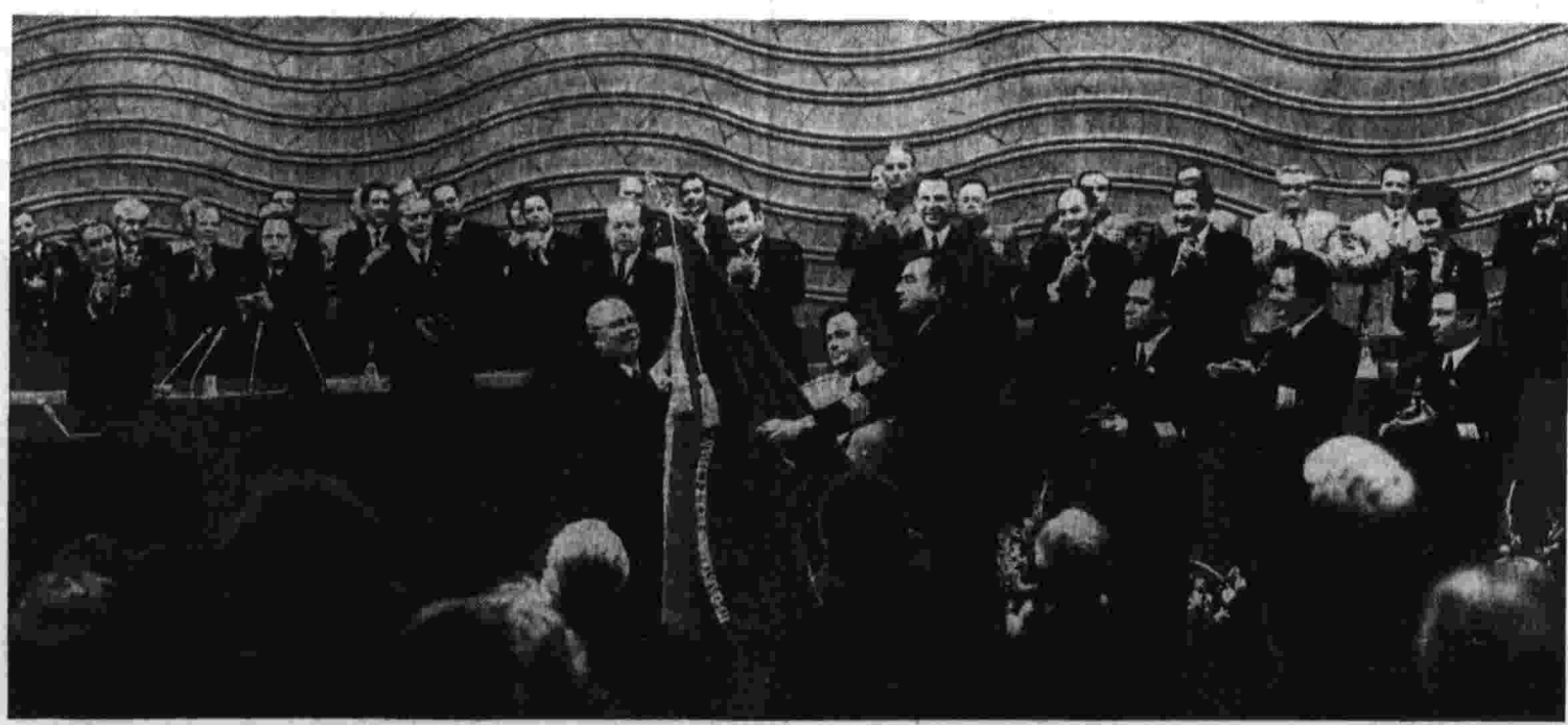
Москва, Кремлевский Дворец съездов. Вручение ордена Октябрьской Революции Аэрофлоту.

замечательными достижениями и успехами! Гражданская авиация Страны Советов прошла большой и славный путь. Ее рождение связано с именем Владимира Ильича Ленина. Еще на заре строительства Советского государства вождь партии и народа прозорливо увидел в авиации одну из наиболее прогрессивных отраслей народного хозяйства, имеющую важнейшее значение для будущего страны социализма. И уже тогда в тяжелой экономической обстановке, несмотря на разруху, Ленин и партия призвали рабочий класс, всех трудящихся незамедлительно приступить к созданию красного воздушного флота.