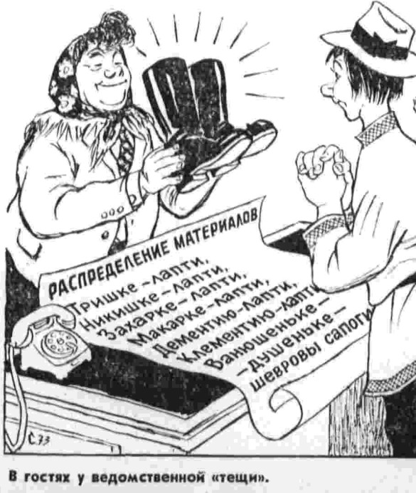
В гостях у ведомственной «тети».

Как свидетельствуют материалы проверки, еще встречаются факты неэффективного подхода при распределении материальных ресурсов среди предприятий, когда «свои» предприятия и учреждения становятся в преимущественное положение.