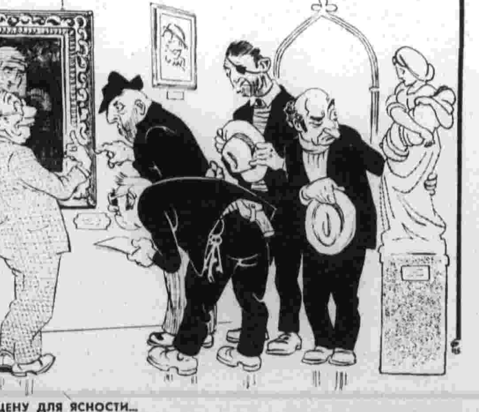
Рис. В. Фомичева.