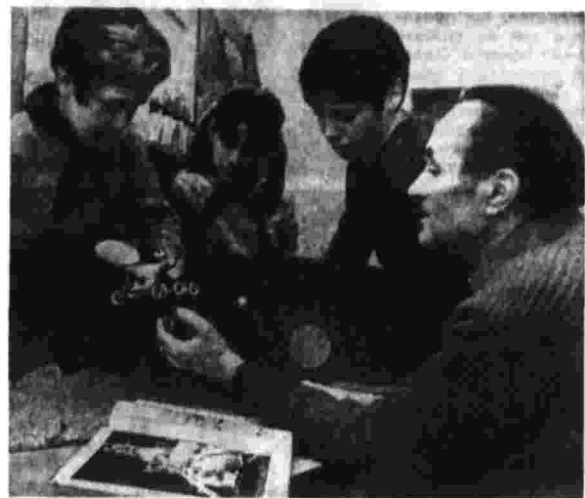
ГДР «Иан устроив Лунокод-21». «Чем он отличается от первой модели?» эти и другие вопросы задают своему руководителю любознательные школьники из астрономического кружка Дома пионеров города Франкфурта-на-Одере.