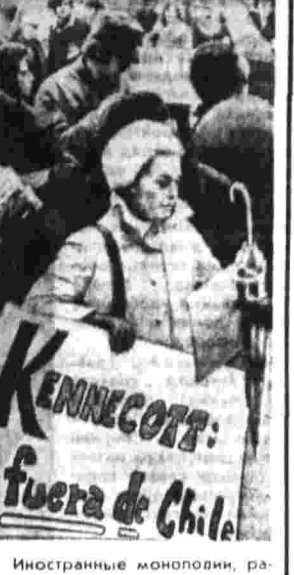
Иностранцы монополии, в чьи руки переходят в силу рыночных законов, расширяют свое влияние на экономику страны, расширяют свое влияние на экономику страны, расширяют свое влияние на экономику страны.

С меньшим шумом, но эффективно действует американская финансовая кулуарная организация «Общий рынок». Она создала возможность объединить свои заводы в Дагемме (Англия), Генке и Антерперге (Бельгия), Кельне (ФРГ) в единый комплекс, который будет держать первое место по количеству произведенных автомобилей в «Общем рынке».