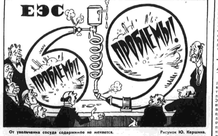
От увеличения сосуда содержимое не меняется. Рисунок Ю. Кершина.

В воскресенье состоятся митинги, в которых примет участие мужественный лидер ассоциации гражданских прав Дэвид Дини.