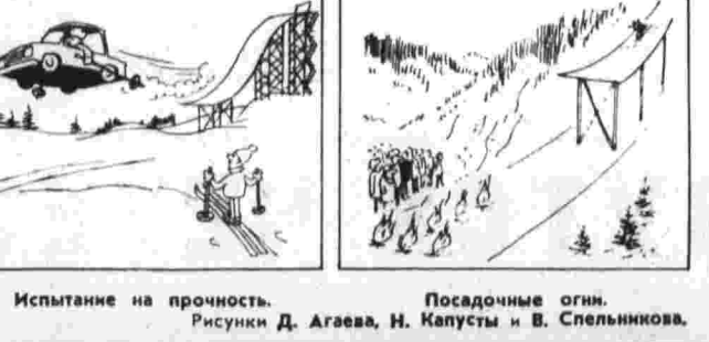
Без слов. Виноват попутный ветер. Испытание на прочность. Посадочные огни.