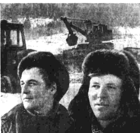
Доблесть идущих впереди