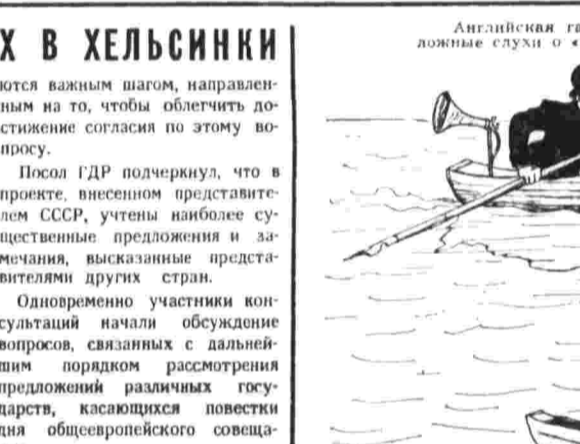
ВРЕДОВОЕ ВОООБРАЖЕНИЕ И ЕГО ОТРАЖЕНИЕ...