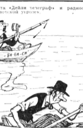
Английская газета «Дейли телеграф» и радиостанция Би-би-си распространяют ложные слухи о «советской угрозе».