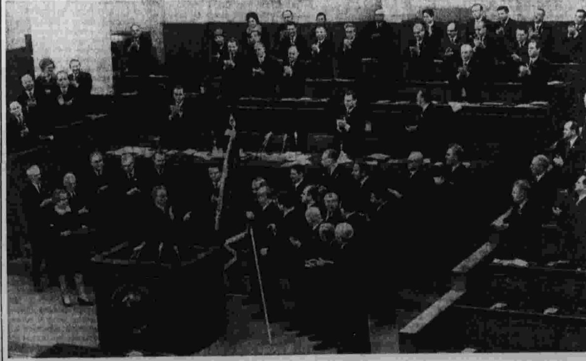
Орден Ленина — на знамени научно-технических обществ.

Генеральному секретарю Центрального Комитета Коммунистической партии Советского Союза товарищу Леониду Ильичу БРЕЖНЕВУ Председателю Президиума Верховного Совета Союза Советских Социалистических Республик товарищу Николаю Викторовичу ПОДГОРНОМУ Председателю Совета Министров Союза Советских Социалистических Республик товарищу Алексею Николаевичу КОСЫГИНУ Дорогие товарищи! Сердечно и горячо благодарю вас за пожелания по случаю моего шестидесятилетия, направленные вами от имени Центрального Комитета Коммунистической партии Советского Союза, Президиума Верховного Совета СССР и Совета Министров СССР. Я расцениваю эти пожелания как еще одно свидетельство доброжелательности и памяти со стороны советских коммунистов. Высокой честью для меня является решение Президиума Верховного Совета СССР о награждении орденом Ленина — особенно почетной для коммуниста наградой интернационалистского значения. Я высоко ценю, товарищи, вашу дружбу. Она помогает в труде и вдохновляет в борьбе за победу социализма, за развитие моей родины и укрепление всего социалистического сотрудничества, главной силой которого является Советский Союз — ологод прогресса и мира на земле. С коммунистическим приветом Эдвард ГЕРЕК Первый секретарь Центрального Комитета Польской объединенной рабочей партии.