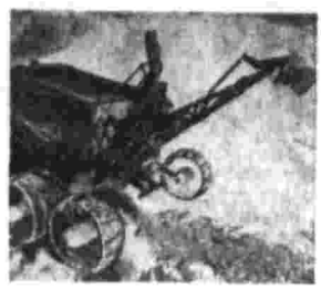
система датчиков для измерения угла наклона поверхности, по которой движется луноход, величины крутящего момента каждого колеса, скорости его вращения, величины пробегания. Проводятся также измерения прогиба лунного грунта...