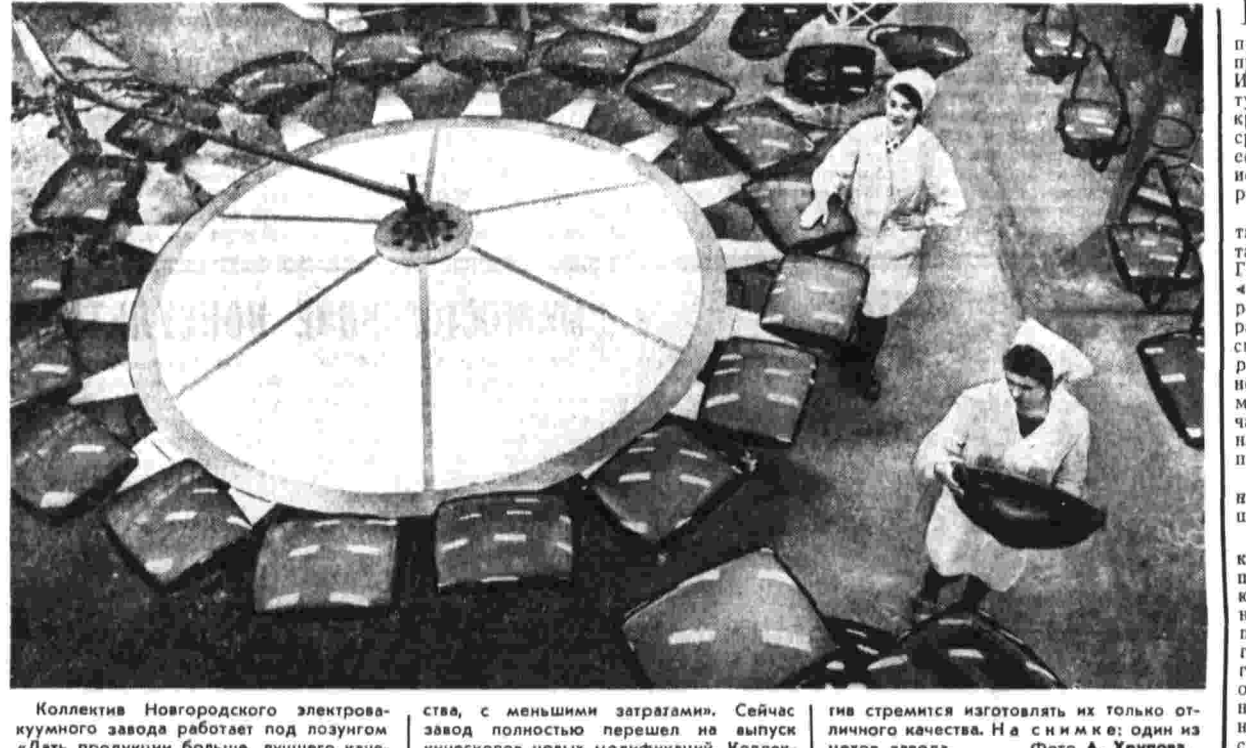
Коллектив Новгородского электромашинного завода работает под позумом «Дать продукции больше, лучшего качества, с меньшими затратами. Сейчас завод полностью перешел на выпуск кинескопов новых модификаций. Коллектив стремится изготовлять их только отличного качества. На с ним же: один из цехов завода.