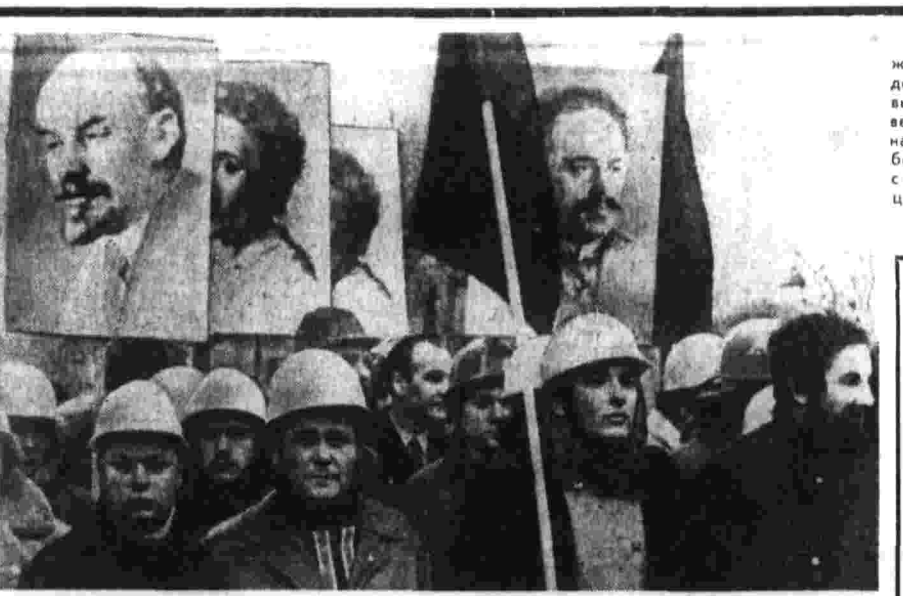
Делегация КПСС в Чили