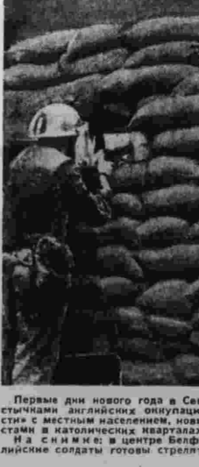
Первые дни нового года в Северной Ирландии ознаменовались столкновениями огульных воинов и «сил безопасности» с местными жителями, новыми повстанческими отрядами и арестами в католических кварталах. На с. и м. в центре Белфаста. Вооруженные до зубов английские солдаты готовы стрелять по «подозрительным».

(Соб. корр. «Правды»). Белфаст—Лондон, январь.