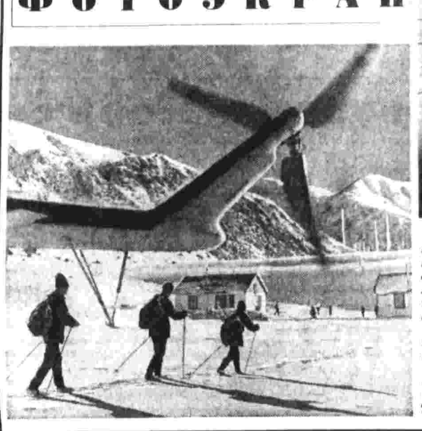
Высоко в горах Западного Тянь-Шаня работают зимовщики снеголавинной станции «Облаки». Кружоломочно, в любую погоду они следят за движением снежных масс, снимают показания приборов. Полученные данные отправляются в Среднеазиатский гидроцентр, где с помощью электротранса составляется прогноз погоды для чабанов и авиаторов, земледельцев и геологов.

В Москве, на Варшавском шоссе, открылась ателье зимних и прачечной самообслуживания. Сейчас в столице работают 37 таких ателье, а к концу пятилетки их количество почти удвоится.