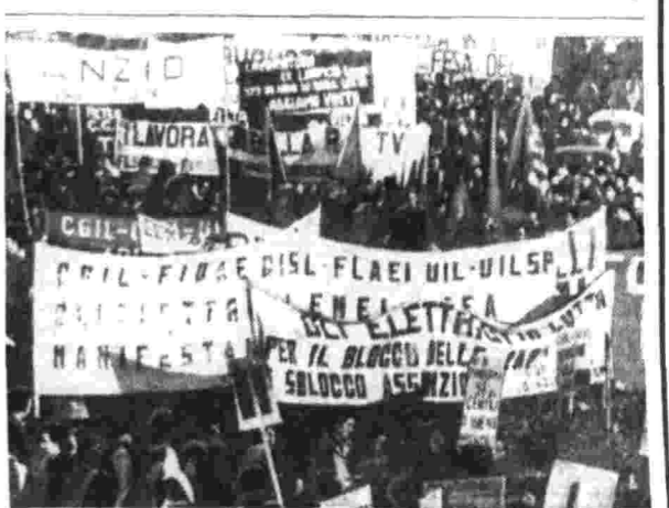
Как сообщалось в «Правде», в Италии прошла общенациональная забастовка...