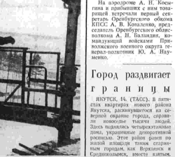
Город раздвигает границы