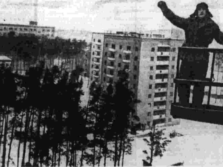
Город раздвигает границы

Ведущие киевские предприятия принимают новые, более напряженные социалистические обязательства на 1973 год, каждое по-своему развивая и углубляя инициативу труженников «Арсенала». Например, завод «Точмашэлектроробор» решил представить в аттестации на государственной Знак качества еще пять типов новых изделий.