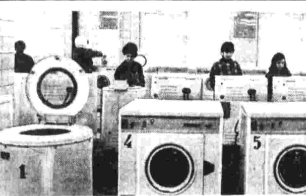
В Москве, на Варшавском шоссе, открылась ателье зимних и прачечной самообслуживания. Сейчас в столице работают 37 таких ателье, а к концу пятилетки их количество почти удвоится.

Наблюдения за движением советской автоматической станции «Луна-21» ведут в эти дни сотрудники Гиссерской астрономической обсерватории Института астрофизики Академии наук Таджикистана.