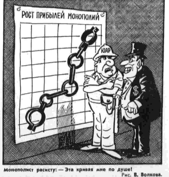
Монополист раскис: — Эта кривая мне по душе! Рис. В. Волкова.