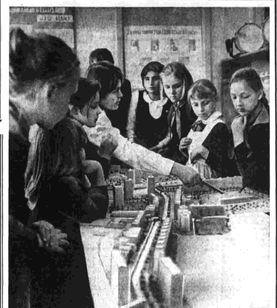
Пока еще нет в Ленинграде улицы Пионерстроя. Но она обязательно будет! Так решила ребята из 290-й школы Кировского района. Эта улица проложат там, где проходили передовые рубежи обороны Ленинграда в годы войны. Школьники задумали украсить ее аллеями берез, большой клумбой в виде звезды из белых и алых гвоздик. Магистраль Пионерстроя будет венчать скульптура барабанщика. На снимке: пионеры 290-й школы еще и еще раз обсуждают детали озеленения своей улицы, им очень хочется, чтобы эта улица была одной из красивейших в городе.

турщины, бессовестные!» По жалобам, других слов их работа и не заслуживает. Не подумайте, что черню всех строителей. Нет, конечно. Большинство из них работает добросовестно, старательно. Но затеяется, скажем, в бригаду паркетников один «мастер тап-ляп» и своим недобросовестным отношением к делу поставит пятно на весь коллектив. А еще встречаются люди, девиц которых — поменьше работать, побольше денег получить. Чего только ради этого они не придумывают! Некоторые штукатуры, например, в цементный раствор добавляють соль. Этот раствор быстрее схватывается, но штукатурка сохнет очень быстро трескается и осыпается. Честные рабочие таким нерадивым людям, конечно, спуска не дают. И разговаривают с ними прямо, без всякой так дипломатии. Но один строгий разговор товарищей хорошо действует, а другие после него и ухом не ведут. Если что-то тут же подают на расчет и переходят на соседнюю стройку. Благо, что строители у нас всюду требуются. К тому же эти люди хорошо знают, что на многих стройках при оплате труда в основном принимается глав-