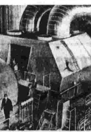
Вот он, энергоблок Эстонской ГРЭС. Сюда идут сланцы из Кокша-Ярва.