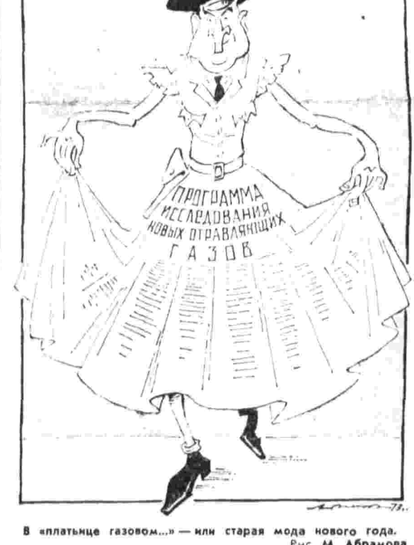
В «платье газом...» — или старая мода нового года.

ВАШИНГТОН, 7. (ТАСС). Президент США Р. Никсон встретился в Камп-Дэвид (штат Мэриленд) со своим помощником Г. Хисниджем.