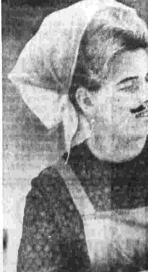
После критики Как сообщила редакция директор Института...