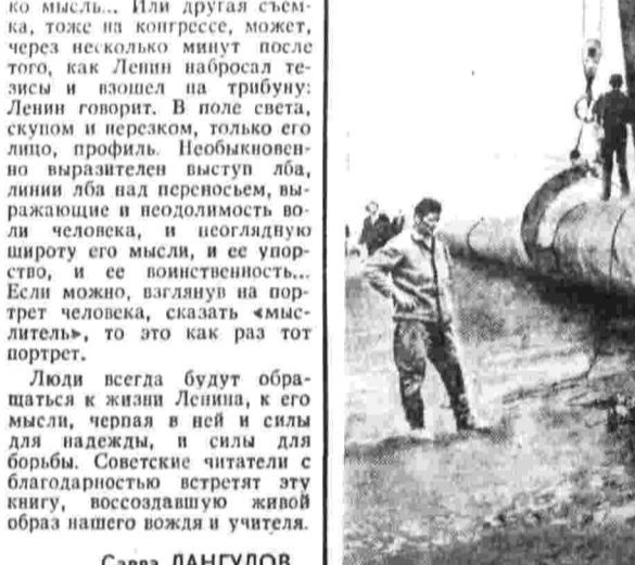
Завершается сварка труб близ города Кощиче (ЧССР).