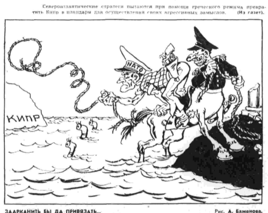
ЗААРКАНИТЬ БЫ ДА ПРИВЯЗАТЬ... Рис. А. Баженова.

Ханой, 3. (ТАСС). Американские стратегические бомбардировщики провели серию новых налетов на территорию Демократической Республики Вьетнам.