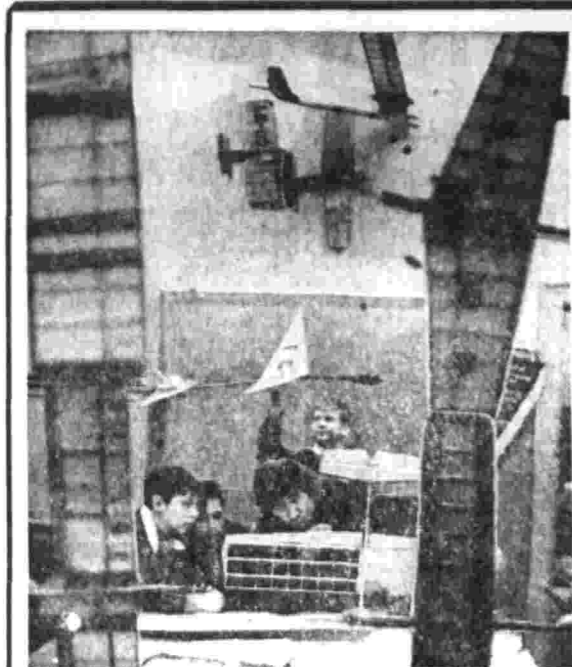
НАСТАЛА веселая пора — зимние школьные каникулы. В Калининском дворце пионеров и школьников один из самых популярных кружков — авиамодельный (справа слева). Ведущие актеры Кунбывского театра оперы и балета занимаются с детьми в балетной студии при театре. На снимке справа — юные балерины в репетиционном зале. На снимке внизу справа — выступает ансамбль «Волховички» Новгородского дворца пионеров и школьников. У мальчишек из свинской одно из самых излюбленных мест — Центральный Музей Вооруженных Сил СССР.