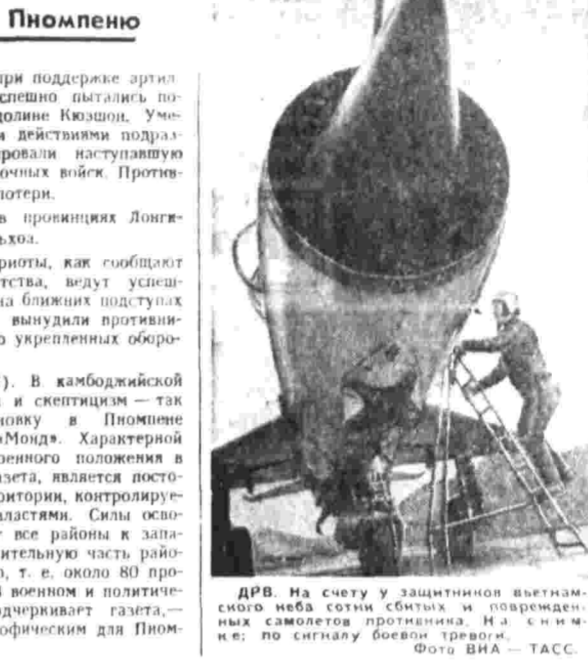
ДРВ. На счету у защитников вьетнамского неба сотни побед и повреждение самолетов противника. На снимке — по сигналу боевой тревоги.

ПАРИЖ, 3. (ТАСС). В камбоджийской столице царит апатия и скептицизм — так характеризует обстановку в Пномпеню французская газета «Монд». Характерной чертой нынешнего военного положения в стране, продолжает газета, является восстановление территории, контролируемой марionеточными властями. Силы освобождения удерживают все районы к западу от Меконга и значительную часть районов к востоку от него, т. е. около 80 процентов территории. «Военном и политическом отношении», подчеркивает газета, — 1972 год был катастрофическим для Пномпеня.