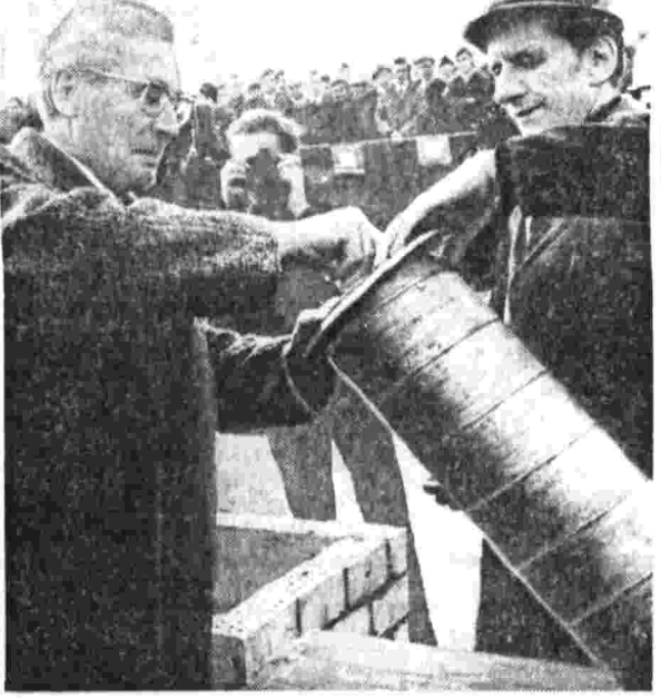
ГДР. С каждым годом повышается уровень благосостояния трудящихся республики. Все шире раздвигаются границы новых жилых кварталов.

В этот день в Берлине в районе Лихтенберг в этой части города будет построено 16.000 квартир.