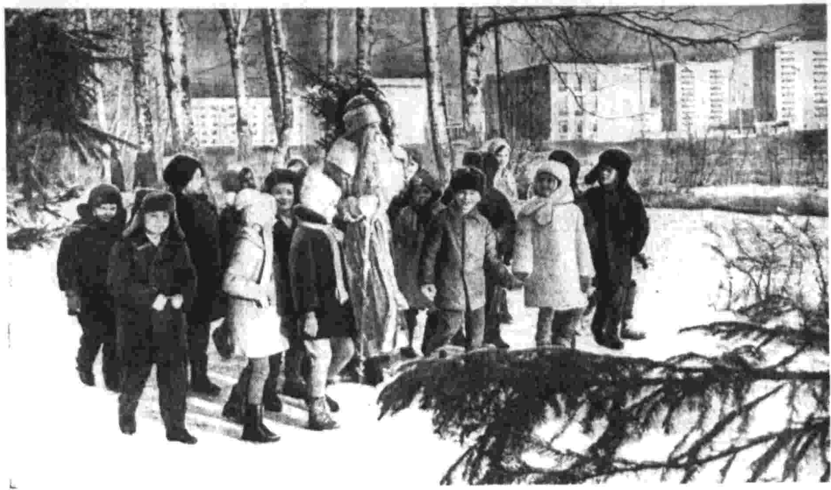
После веселого карнавала у елки пригласили Дедушку Мороза на экскурсию Ребята из совхоза «Московский» Ленинского района Московской области...