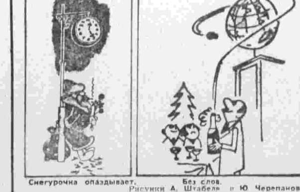
Снегурочка опаздывает. Рисунок А. Шабалы и Ю. Черепанова.

И. ИЛЬИНСКИЙ: Надо же! Дед Мороз! Ну и ну! А. РАЙКИН: Насмешил ты, даядя Юра! Только зверь-то твой не встал, потому что меткий юмор убивает наповал. Сергей ВАСИЛЬЕВ. Рисунок И. Семенова.