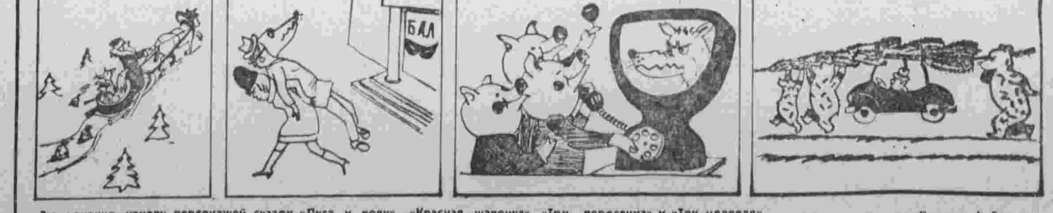
Вы, конечно, узнали персонажей сказок «Лиса и волк», «Красная шапочка», «Три поросенка» и «Три медведя». Рисунок А. Грунина.