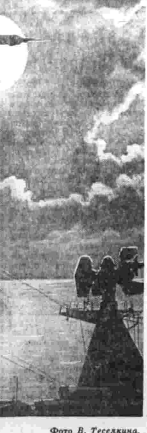
Утро Нового года.

С. ПАСТУХОВ (Корр. «Правды»), Хабаровский край.