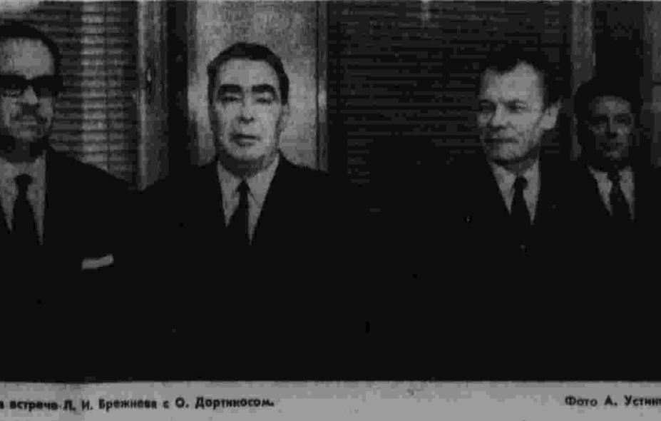
Москва, 24 декабря. На встрече Л. И. Брежнев с О. Дортником.