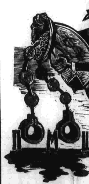
КАНДАЛЫ В КРЕДИТ. Линогравюра М. Литвина.