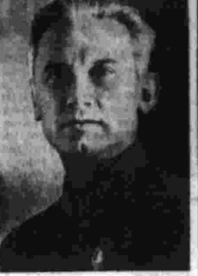
А. А. Фадеев

Вот почему Фадеев не мог не вспомнить такой эпизод. В тот же первый приезд к нам на фронт столкнулся он с таким случаем.