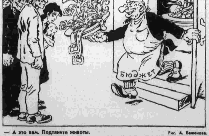
— А это вам. Подтяните животы.

Как показала обследование, проведенное службой здравоохранения США, систематически оказывают на ираиней мере 15 миллионов американцев, в том числе 12 миллионов детей (из газет).