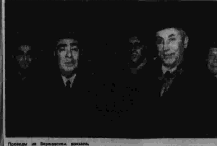
Проводы на Варшавском вокзале. Телюфера В. Мусальнича (ТАСС).

Пятилетка — дело всей партии, всего народа. Отвечая на решения Пленума ЦК КПСС и сессии Верховного Совета СССР новыми трудовыми достижениями, массовой инициативой в борьбе за повышение эффективности производства, советские люди говорят уверенно и единодушно: — Пятилетний план — выполнен!