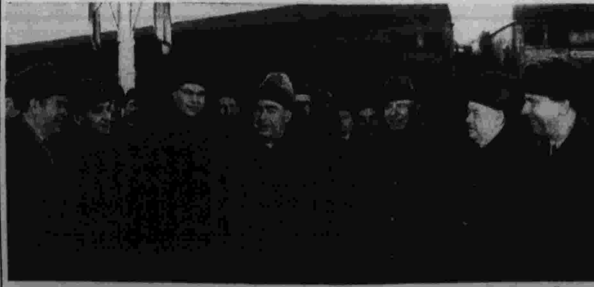
Проводы на Белорусском вокзале.

ке. На встрече были Председатель Совета Министров Эстонской ССР В. И. Клуусон, Председатель Совета Министров Узбекской ССР Н. Д. Худайбердыев, заместитель министра иностранных дел СССР А. И. Смирнов, посол СССР в Дании Н. Г. Георгиев.