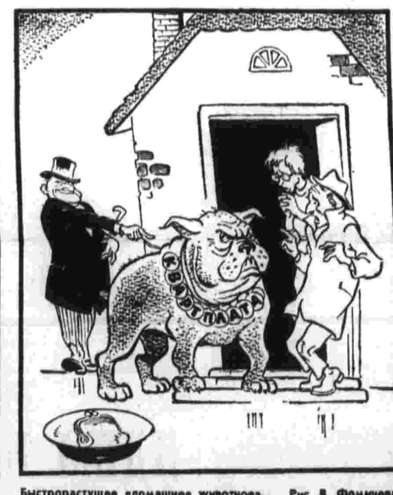
Быстро растущее «домашнее животное»... Рис. В. Фомичева.