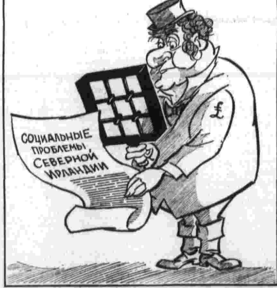
Вооруженным глазом.