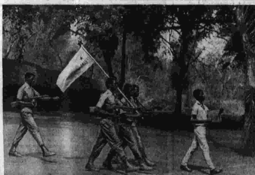
На сцене запечатлен момент церемонии перед поднятием флага в ознаменование 10-летия ПАМГК, расположенной в районе Мадина-Воз (Восточный фронт).

В перипетиях этой борьбы влился в историю с наследством Шмита. Согласно его завещанию большевики были абсолютно законными и единственными владельцами этого состояния. Пенсиями эту сумму за управление делами партии. В. И. Ленин передал делеги большевикам на хранение трех великих социаль-демократов, так называемых «держателей», с условием, чтобы эти средства расходовались только лишь на общепартийные цели. Владимир Ильич предупреждал, что деньги