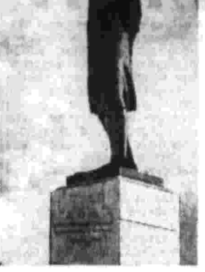
второй раз. Побывали в музее. Да, быть такой, как Зоя, смелой, наверное, не каждый. Я низко кланяюсь тебе, Зоя!