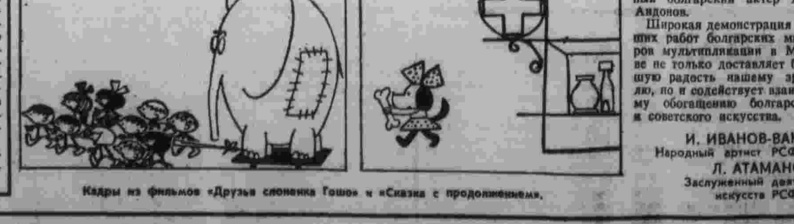
Кадры из фильмов «Друзья слоненка Гошо» и «Связка с продолжением».

И. ИВАНОВ-ВАНО. Народный артист РСФСР, Л. АТАМАНОВ. Заслуженный деятель искусства РСФСР.