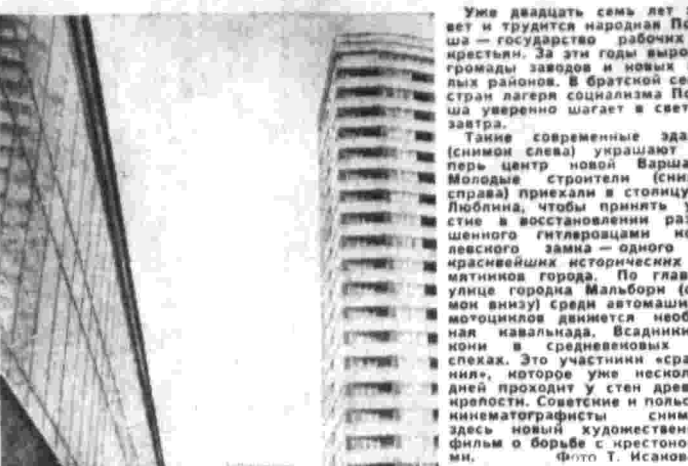
Уже двадцать семь лет живет и трудится народная Польша — государство рабочих и крестьян. За эти годы выросли громады заводов и новых жилых районов. В братской семье стран лагера социализма Польша уверенно шагает в светлое завтра. Также современные здания (справа) уррашают теперь центр новой Варшавы. Молодые строители (справа) приехали в столицу из Люблина, чтобы принять участие в восстановлении разрушенного исторического морского замка — одного из красивейших исторических памятников страны. По главной улице города Мальборг (справа вверху) среди автомашин и мотоциклов движется необычная караванная. Всадники и кони в средневековых доспехах. Это участники «средневековых игр», которые уже несколько дней проходят у стен древней крепости. Славянские и польские кинематографисты снимают здесь новый художественный фильм о борьбе крестьянства.