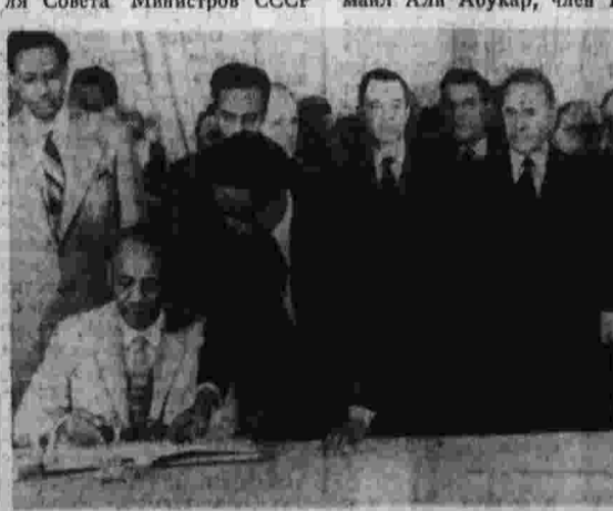
Подписание советско-сомалийских документов.

19 ноября в Большом Кремлевском дворце состоялось подписание советско-сомалийских документов. Советско-сомалийское заявление подписали Председатель Президиума Верховного Совета СССР Н. В. Подгорный и Президент Верховного революционного совета Сомалийской Демократической Республики генерал Мохамед Сина Барре.