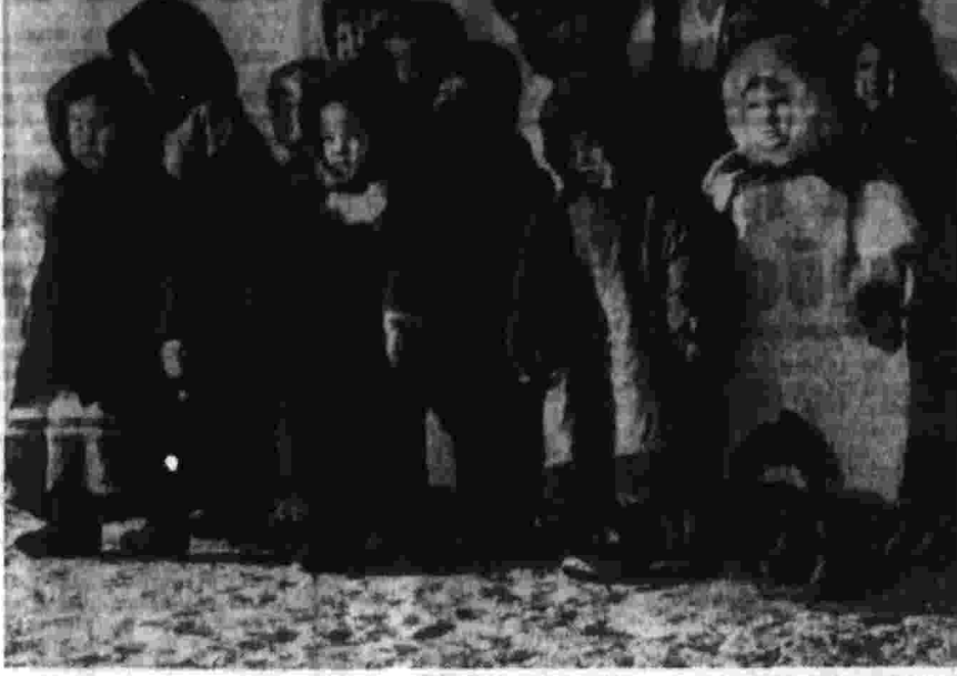
Большой заботой окружает Страна Советов своих молодых граждан. В самых отдаленных районах для них строятся школы, санатории, спортивные комплексы.