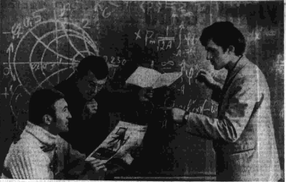
За последние годы Красноярская студия телевидения обрела много интересных сюжетов. Об этом и впечатляюще рассказывает она в своем крае, о жизни, делах и работах тружеников полей, востроге Сибири.