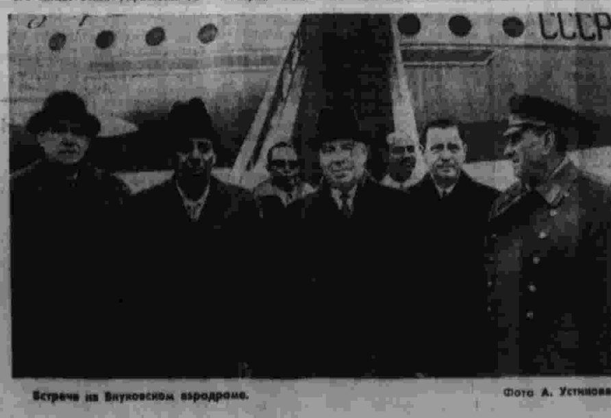
Встрече на Внуковском аэродроме.

ПАРИЖ, 16. (ТАСС). По призыву крупнейших профессиональных объединений — Всеобщей конфедерации труда и Французской демократической конфедерации трудящихся — сегодня на всех предприятиях металлургической промышленности Лотарингии начались 24-дневная забастовка. Она проводится в знак протеста против намеченного сокращения в этом крупнейшем промышленном районе Франции более 12 тысяч рабочих мест. ФКП, социалистическая партия, объединенная социалистическая партия призвали своих сторонников к участию в митингах.