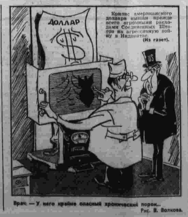
Враг — у него крайне опасный хронический порок... Рис. В. Волкова.

РИМ, 11. (ТАСС). Здесь открылся пленум Центрального Комитета и Центральной контрольной комиссии Итальянской компартии. Пленум обсудит вопрос о съезде и подготовке XIII съезда ИКП. Докладчик — заместитель Генерального секретаря ИКП Э. Берлигуар.