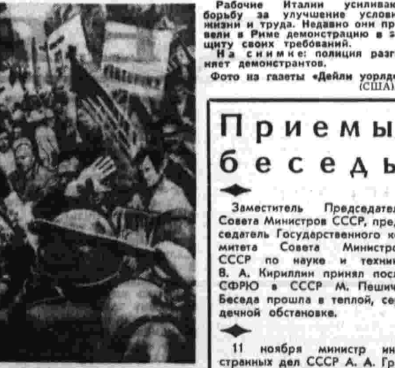
Рабочие Италии усиливают борьбу за улучшение условий жизни и труда. Недавно они провели в Риме демонстрацию в защиту своих требований. На с. и м.к.: полиция разгоняет демонстрантов.

ПРАГА, 11. (ТАСС). По приглашению ЦК КПЧ и правительства ЧССР сегодня в Чехословакию с дружественным визитом прибыла партийно-правительственная делегация ГДР во главе с Первым секретарем ЦК СЕПГ Э. Хонеккером. В состав делегации входят член Политбюро ЦК СЕПГ, Председатель Совета Министров ГДР В. Штоф и другие видные руководители ГДР. На вокзале в Стожове, близ Кладно, гостей встречил Генеральный секретарь ЦК КПЧ Г. Гусак, член Президиума ЦК КПЧ. Председатель правительства ЧССР Л. Штроугал, другие видные руководители ЧССР. Сегодня в замке Лани начались переговоры между делегациями обеих стран.