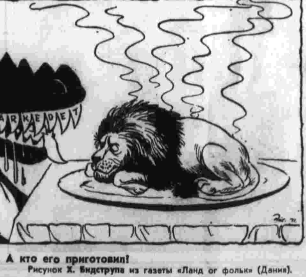
— Appetitное блюдо. А кто его приготовил! Рисунок Х. Вилдструпа из газеты «Ланд оф фолк» (Дания).