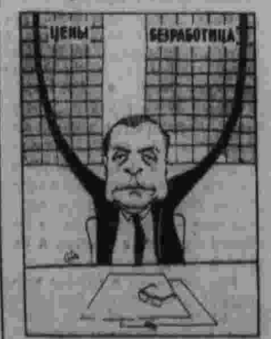
Рисунок из газеты «Драго ружье» (Бельгия).