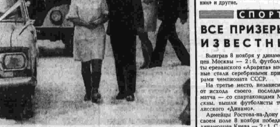
Большим успехом у зрителей пользуется спектакль «Баранкин, будь человеком» постановки юными актерами и куколочниками воспитанниками Волгоградского Дворца пионеров и школьников. Хороший подарок к годовщине Октября получили жители Душанбе — открыли новый плавательный бассейн. Это комплекс из трех ванн, разномощный залов. Много работ у работников загса города — строителей Камского автозавода Набережные Челны. Ведь большинство его населения — молодежь.