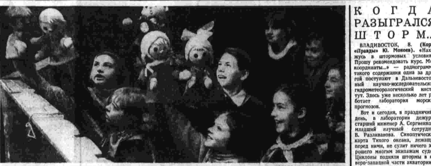
В дни праздника Октября