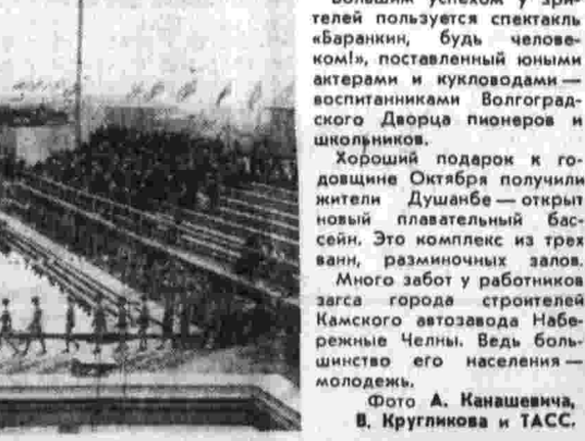
Большим успехом у зрителей пользуется спектакль «Баранкин, будь человеком» постановки юными актерами и куколочниками воспитанниками Волгоградского Дворца пионеров и школьников. Хороший подарок к годовщине Октября получили жители Душанбе — открыли новый плавательный бассейн. Это комплекс из трех ванн, разномощный залов. Много работ у работников загса города — строителей Камского автозавода Набережные Челны. Ведь большинство его населения — молодежь.

Первые такие попытки были сделаны в 50-х годах в США. Однако опыты закончились безрезультатно. В прошлом году предприняты новые попытки зафиксировать мощные импульсы излучения, которые могли быть результатом астроинженерной деятельности внеземных цивилизаций. Тщательный анализ материалов показал, что в период наблюдений подобных импульсов в Галактике, по-видимому, не было. Эти эксперименты привели ученых к выводу о необходимости дальнейших поисков с использованием значительно больших антенн, обеспечивающих более высокую чувствительность. Участники недавней международной встречи — советские