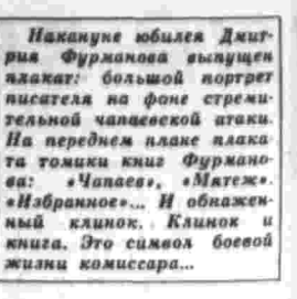
Наканиуне юбилея Дмитрия Фурманова вылучен алякат: большой портрет писателя на фоне стремительной чапаевской атаки. На переднем плане аляката томика кнш Фурманова: «Чапаев», «Матей», «Набранное». И обложка альманаха «Книжки и жнши. Это символ боевой жнши комиссара».

— Мы видим оригинальное кирпичное здание в лесах в начале Волынской улицы. Что это такое? — По инициативе труженников предприятий района здесь создается на общественных началах историко-революционный заповедник. Откроется музей