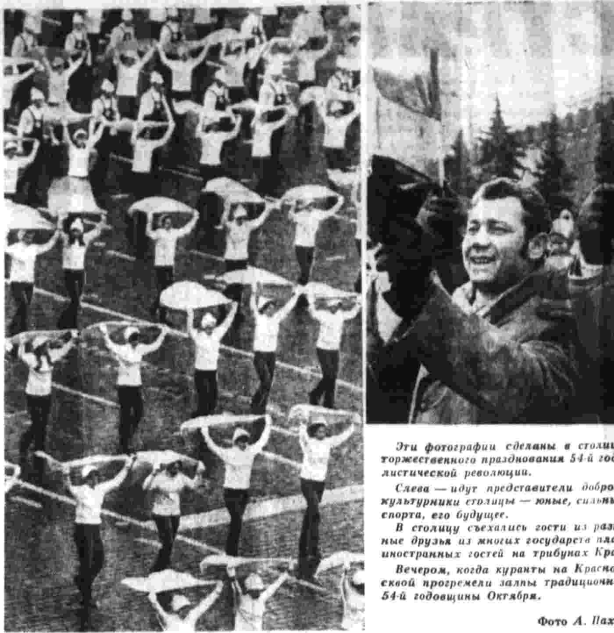
Эти фотографии сделаны в столице нашей Родины Москве во время торжественного празднования 54-й годовщины Великой Октябрьской социалистической революции.

Центральное телевидение СССР в четное воскресенье 7 ноября в 5-ю годовщину Великой Октябрьской социалистической революции транслирует военный парад и демонстрацию представителей трудящихся на Красной площади в Москве.