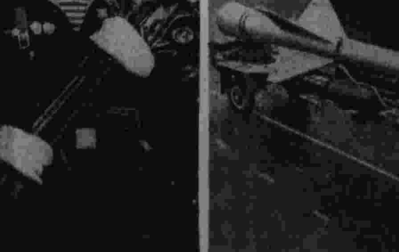
На марше — участники военного парада.