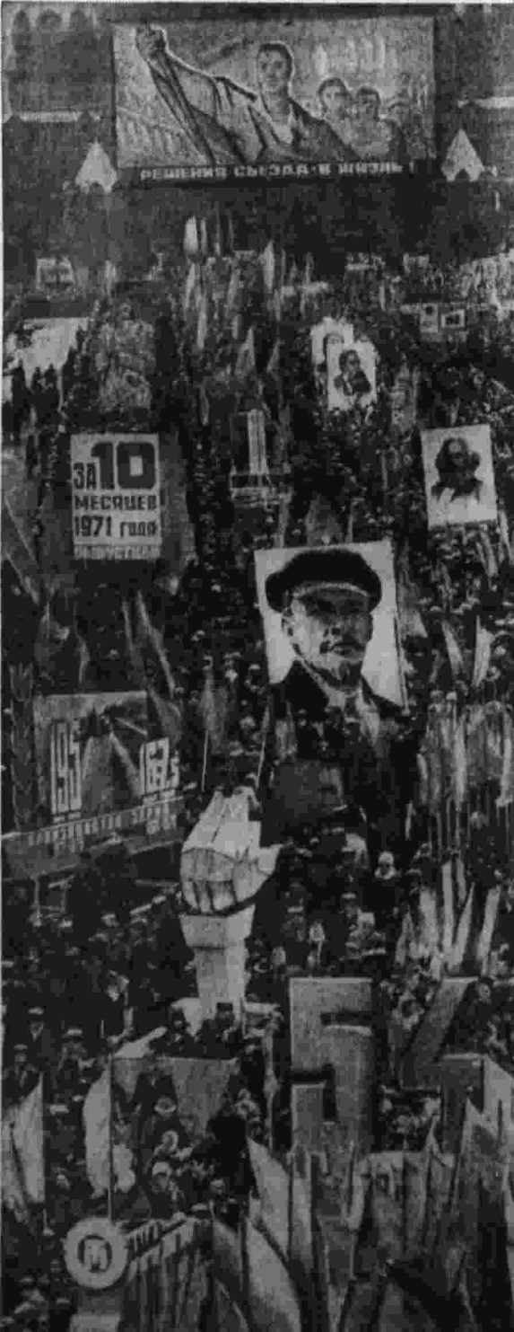
Красную площадь заполнили колонны демонстрантов.

Вечером в московском небе вспыхнули огни праздничного салюта. Ю. АПЕНЧЕНКО, Н. КОРШУНОВА, Л. ЛЕБЕДИН, В. ЛЕВИН, Я. МАКАРЕНКО. г. Москва, 7 ноября.