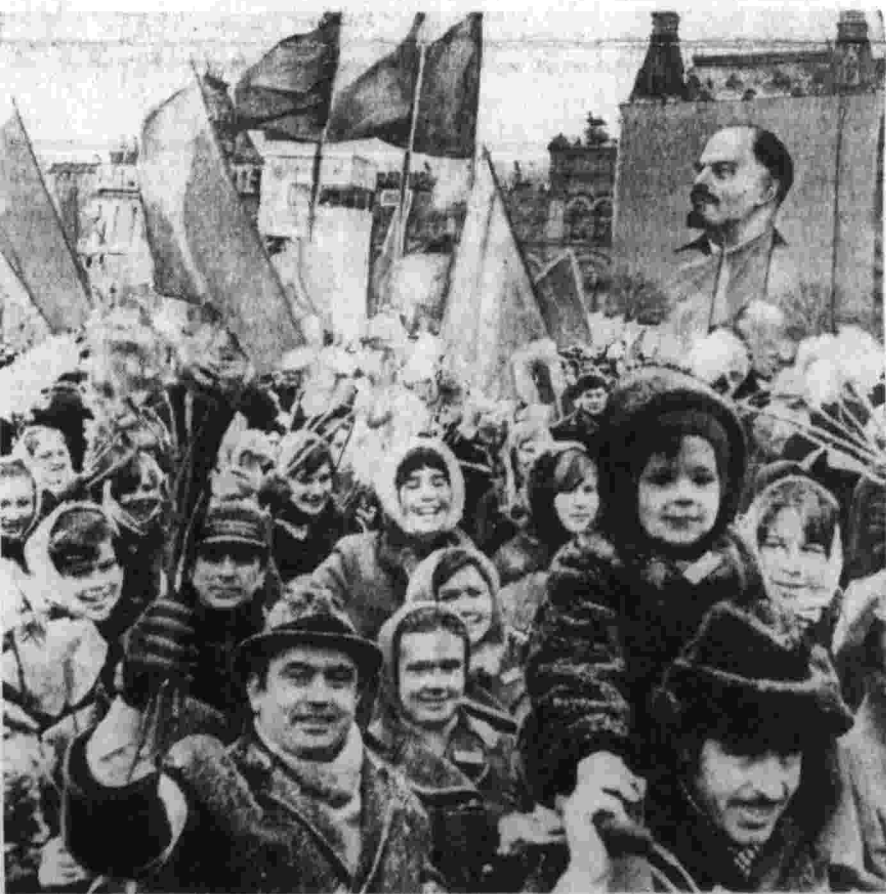
Демонстрация трудящихся Москвы на Красной площади 7 ноября 1971 года.

В едином боевом строю с армиями братских социалистических стран воины наших Вооруженных Сил и впредь будут надежно охранять мирный созидательный труд советского народа, достойно выполнять свой патриотический и интернациональный долг. Да здравствует пятидесятая годовщина Великой Октябрьской социалистической революции!