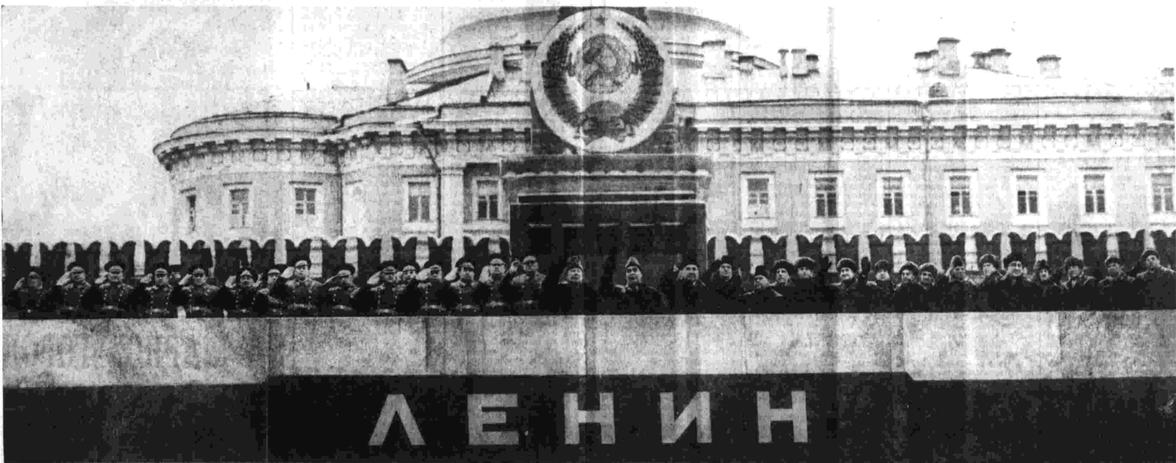
Москва, Красная площадь. 7 ноября 1971 года. На трибуне Мавзолея В. И. Ленина.

Праздничные торжества во всех городах и селах нашей Родины вновь убедительно продемонстрировали нерушимое единство партии и народа, готовность советских людей претворить в жизнь решения XXIV съезда КПСС.