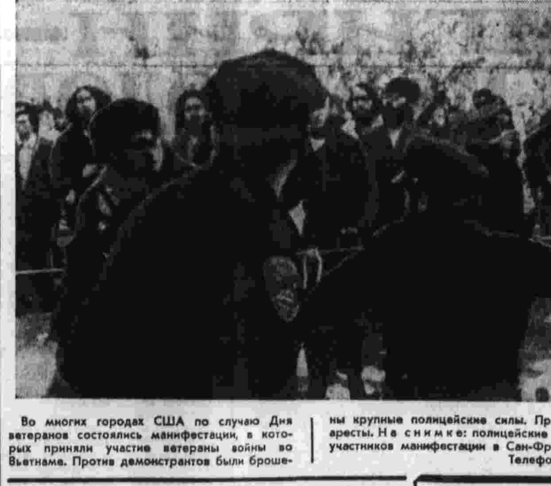
Во многих городах США по случаю Дня ветеранов состоялись манифестации, в которых приняли участие ветераны войны во Вьетнаме. Против демонстрантов были брошены крупные полицейские силы.

КАИР, 25. (ТАСС). Президент АРЕ Авар Садат обратился сегодня к нации в связи с начинающимися первыми заседаниями народных советов провинций.