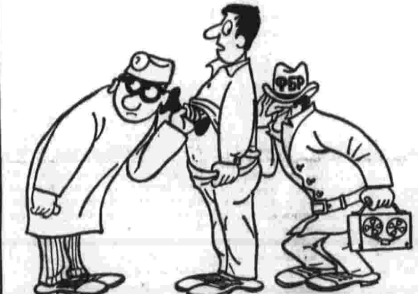
— Доктор! Вас, кажется, подслушивают. Рис. В. Тильманна.

В погоне за «наномыслиями» Федеральное бюро расследований (США) организовало тотальную слежку в стране. (Из газет.)