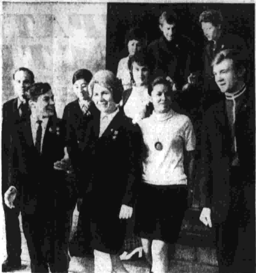
Сегодня в Москве открывается Всесоюзный слет студентов. О делах и планах советского студенчества читайте на третьей странице этого номера. На снимке: группа делегатов Всесоюзного слета.