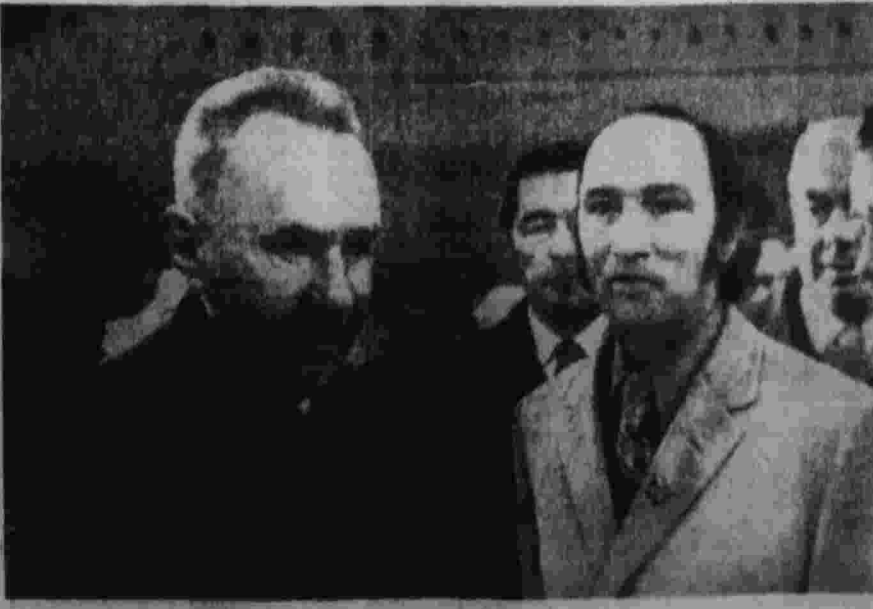
Во время встречи в оттавском аэропорту Андела.

Состоявшиеся во время визита беседы и обмен мнениями оказались полезными и будут способствовать дальнейшему развитию дружественного сотрудничества между обеими странами, упрочению мира и международной безопасности.