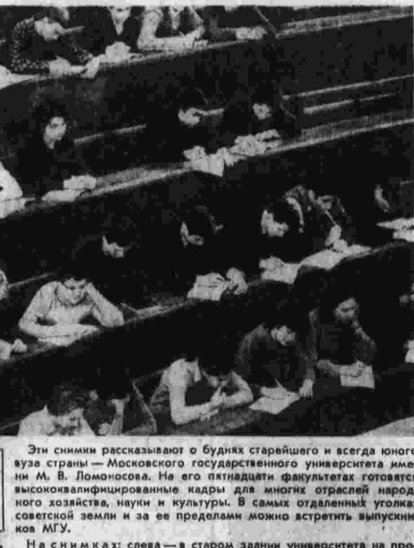
Эти снимки рассказывают о буднях старшего и всегда юного вуза страны — Московского государственного университета имени М. В. Ломоносова...