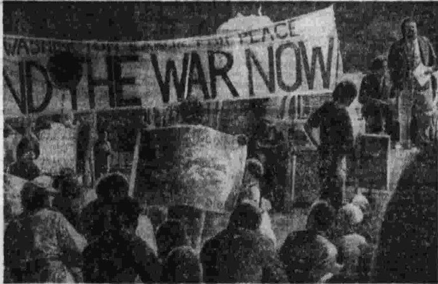
На снимке: антивоенная демонстрация в Вашингтоне.

Советский комитет защиты мира направил телеграмму американским сторонникам мира — участникам общенационального движения за прекращение войны в Индокитае. В ней, в частности, говорится: «Ваша манифестация особенно красноречиво свидетельствует о тех сильных антивоенных настроениях, которые охватили ныне большинство американского народа и которые находят выражение в открытых протестах против про-