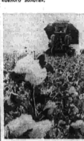
«При сравнении итогов соревнования различных коллективов необходимо прежде всего учитывать на практике принятые и выполненные планы, а также уровень производственных затрат».

Допоздна не стихает гул уборочных машин на полях колхоза имени Калинина Саятского района.