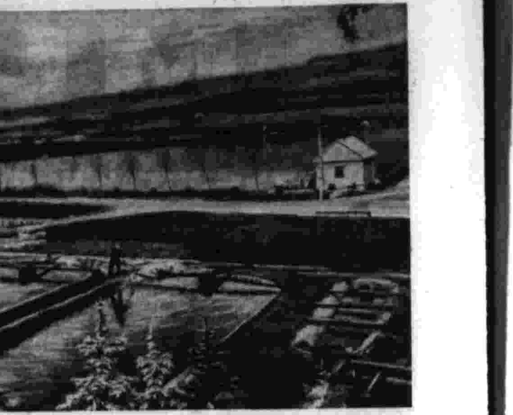
Рыбоводческое хозяйство Предгорного района раскинулось в живописной долине на северной окраине Кисловодска. Зеркало воды одного из озер занимает 10 гектаров. В нынешнем году озеры поступит в продажу более 25 тонн сербского карпа и 5 тонн форели.