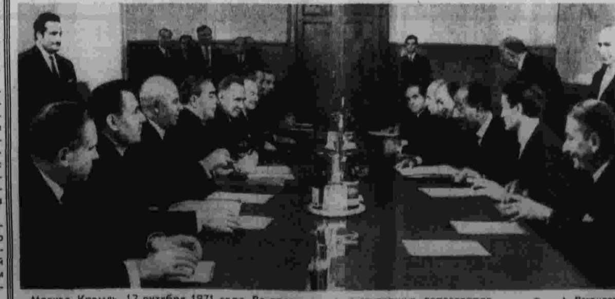
Москва, Кремль. 12 октября 1971 года. Во время советско-египетских переговоров.